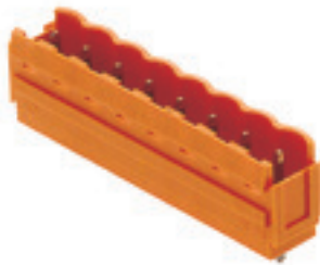
Similar a la ilustración

No utilizar el producto para nuevos desarrollos